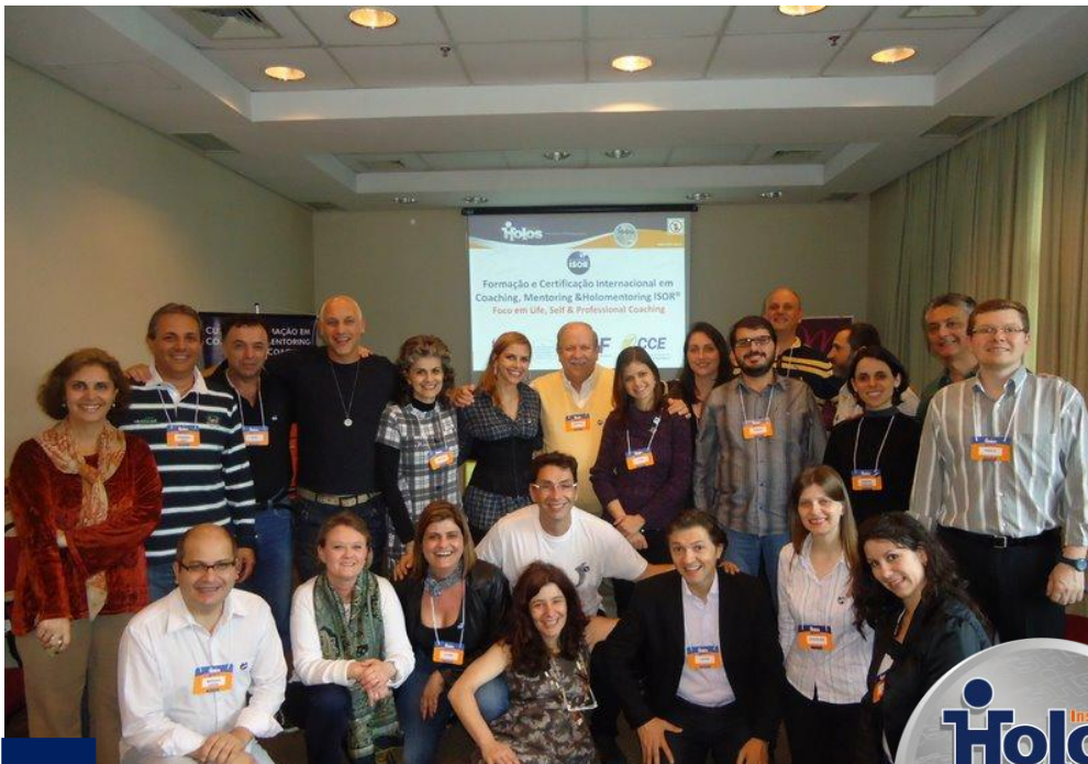
Turma de BH 2011